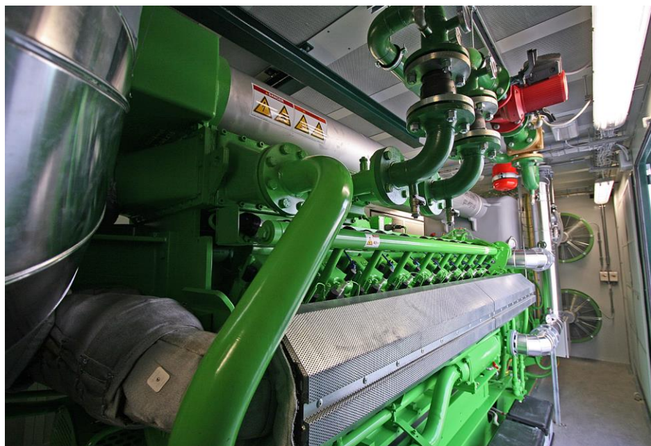
I quattro motori di cogenerazione sono alimentati dal gas prodotto dalle biomasse e producono un totale di 4 MWe di energia elettrica, con emissione di CO2 zero.

L'iniziativa ha dato vita al più grande impianto energetico nazionale a biogas da biomassa agricola: quattro centrali energetiche elettriche alimentate dal biogas proveniente dalla digestione anaerobica di